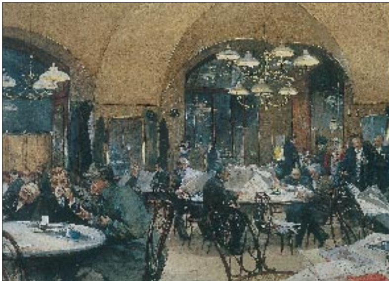
Wiener Kaffeehaus um die Jahrhundertwende. Aquarell von Reinhold Volkel (Bildarchiv Preußischer Kulturbesitz)

umfaßte schließlich Kunst-, Konzert- und Gesangvereine, Studentenverbindungen, Denkmalsvereine, Kleingarten-, Freikörperkultur-, Volkstanz-, Wander-, Jugend-, Verschönerungsvereine sowie Sportvereine aller Art. In dieser Vielfalt zeigt sich die ganze Bandbreite der Freizeitinteressen, und vieles hat sich davon bis heute erhalten, wenn auch der modernen Zeit angepaßt.