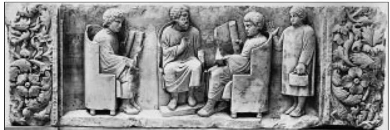
Lehrer mit Schülern beim Unterricht: Relief aus der römischen Kaiserzeit

Neben der Pflege von Kultur und Demokratie hatte insbesondere Cicero noch eine andere Vorstellung von der Muße, die auf spätere Zeiten nachwirken sollte: Unter „otium“ verstand er die öffentliche Ruhe und Sicherheit, das ungestörte allgemeine Wohl und tätige Einvernehmen der Behörden und der Bürgerschaft. Diese Vorstellung einer friedvollen Atmosphäre und einer wohlgesinnten Eintracht im Zusammenwirken aller Bürger findet sich in Deutschland im Mittelalter wieder.